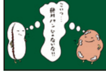
アンカンミンカン川島 twitter フォロワー募集中! twitter:「アンカンミンカン川島」で検索! @waaaaa_maajaa_ 気軽にフォローミー!