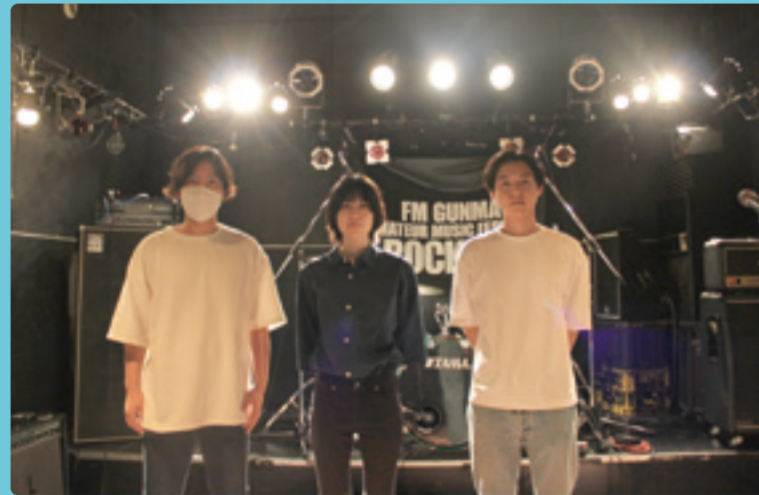
Sydney at 9:00

① エレクトリック・プランクトン / ② エレクトリック・プランクトン (Vo./Gt./Ba./その他打ち込み音源) / ③ 2020年活動開始。どこか懐かしいメロディと染み込むような歌声を武器にROCKERSに初挑戦! アコギ1本での弾き語りからエレクトリックなバンドサウンドまで。YouTubeでは、自分のルーツとも言える楽曲に、独自のアレンジを加え発信中です。 / ④ ROCKERS初出場です。未だ先の見えないこんなご時世だからこそ聴いてほしい歌がここにあります。決勝ではギター1本での弾き語りになりますがシンプルに僕の歌を響かせたいと思います。たくさんの人に届きますように。